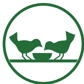
ČESKÁ FEDERACE POTRAVINOVÝCH BANK

Tato barevnost je podmínkou ke správnému použití loga v barevné podobě.